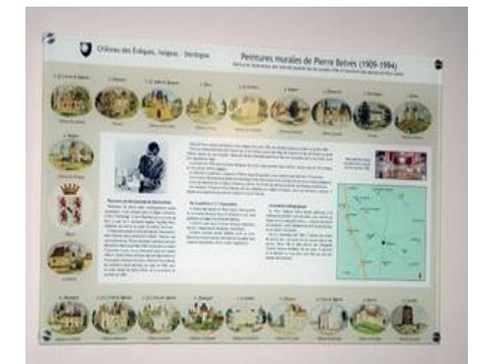
Plaque commémorative élaborée par l'association- sept. 2015

Lors de ses séjours, pendant les grandes vacances, il croque sur des carnets des moulins, des demeures, des châteaux du canton. En 1952, il réalise une série de médaillons sur le balcon de la Salle des Fêtes du Château des Evêques.